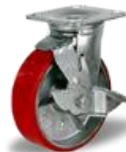
C-4102-DUS (полиуретан) поворотное с тормозом

При оптовых закупках предоставляется скидка до 20%